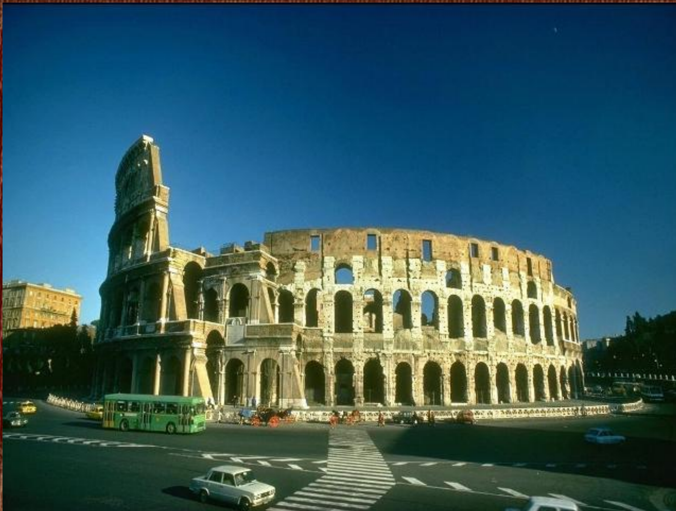
Колизей. Современный вид