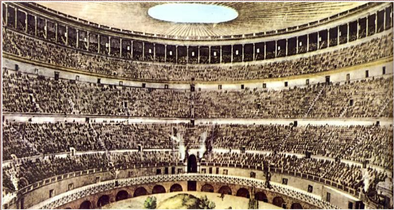
Представление в цирке Рисунок-реконструкция

Гладиаторы должны были участвовать в представлениях для свободных римлян, которые устраивались в больших цирках.