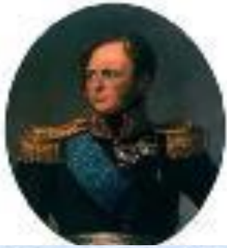
Император Александр I