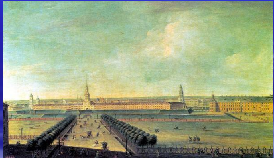
Адмиралтейство. Гравюра А. Зубова, 1716 г.

А в 1704 году на левом берегу Невы заложили главное Адмиралтейство и к 1706 году завершили строительство Адмиралтейской крепости , прикрывавшей южные подступы к Петербургу.