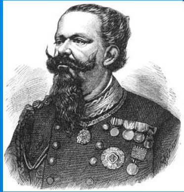
Виктор Эммануил II