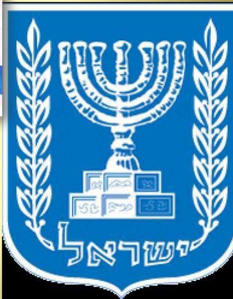
Герб Государства Израиля