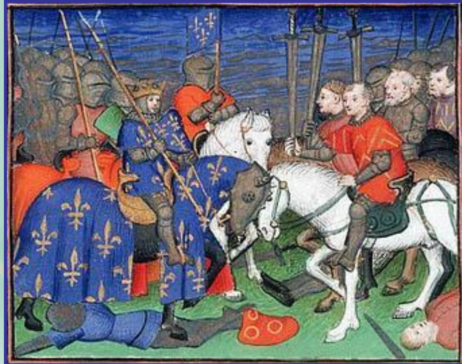
Битва при Бувине

В 1214 году Филипп II в ожесточённой битве при Бувине наголо разгромил своих противников и захватил богатые трофеи. У англичан осталась лишь часть Аквитании.