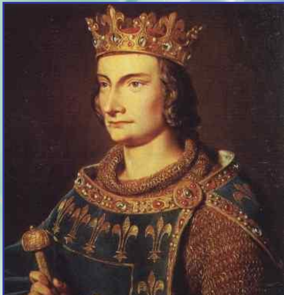
Филипп IV Красивый

При Филиппе IV Красивом было присоединено богатое графство Шампань и лежащая в Пиренейских горах на юге страна Наварра.