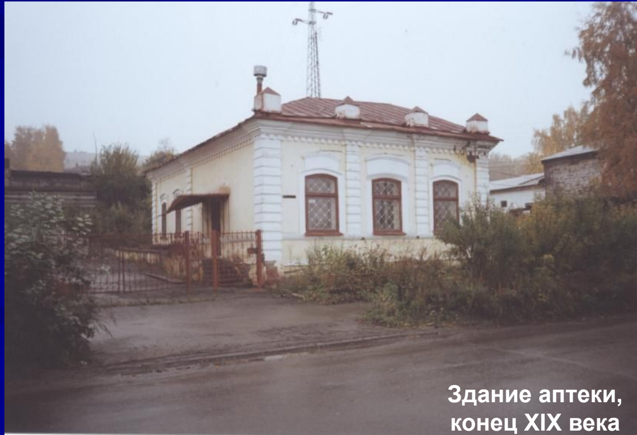
Здание аптеки, конец XIX века

Над оконными проемами, повторяя их дугу, из стены выступают сандрики. Для выделения центрального окна его сандрик сделан длиннее. Здание является памятником архитектуры местного значения.