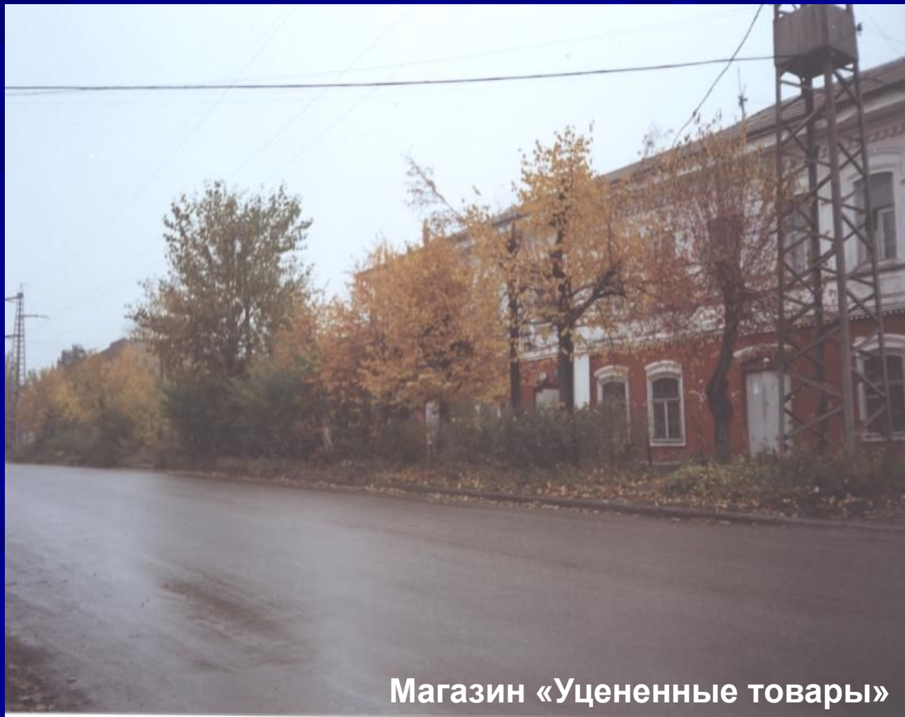
Магазин «Уцененные товары»

В полу магазина была расположена дверца. Открылся глубокий каменный подвал, на самом дне которого просматривались венцы прямоугольного сруба, уходящего вниз и в глубине заваленного землей. Похоже, что это и есть вход в то самое подzemелье, идущее от старой милиции.