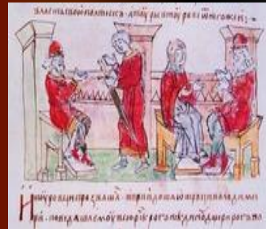
Сватовство Владимира к Рогнеде ( миниатюра из Радзивилловской летописи)