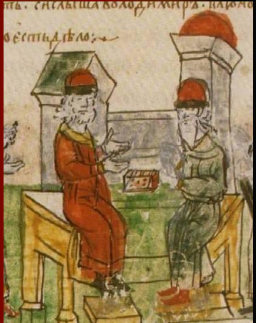
Беседа с греческим философом