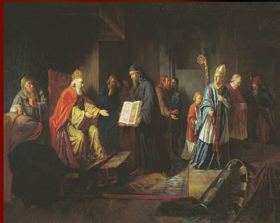
Выбор веры князем Владимиром

"Повесть временных лет" рассказывает, что в 986 г. в Киеве появились представители всех трёх перечисленных стран, предлагая Владимиру принять их веру. Ислам был отвергнут князем, поскольку ему показалось чересчур обременительным воздержание от вина, иудаизм - из-за того, что исповедовавшие его евреи лишились своего государства и были рассеяны по всей земле. Отверг князь и предложение перейти в веру, сделанное посланцами папы римского. Проповедь же представителя византийской церкви произвела на князя самое благоприятное впечатление.