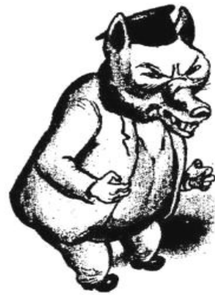
2. Кулак в колхозе

Ликвидация кулачества имела своей целью обеспечение колхозов материальной базой. В 1-й половине 1930 г. Было раскулачено 320 тыс крестьянских хозяйств. Их имущество отошло к колхозам. Все кулаки делились на 3 категории-те кто боролся с Советской властью подлежали расстрелу, наиболее богатые выселялись в отдаленные территории СССР, а остальные расселялись на участках за пределами колхозных земель.