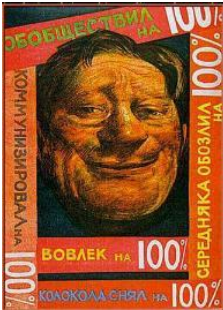
Карикатура 1929 г. Головоотяп на 100%.

В ряде районов крестьяне оказали массовое сопротивление раскулачиванию-они отказывались от вступления в колхозы, уничтожали скот и инвентарь, поднимали восстания.