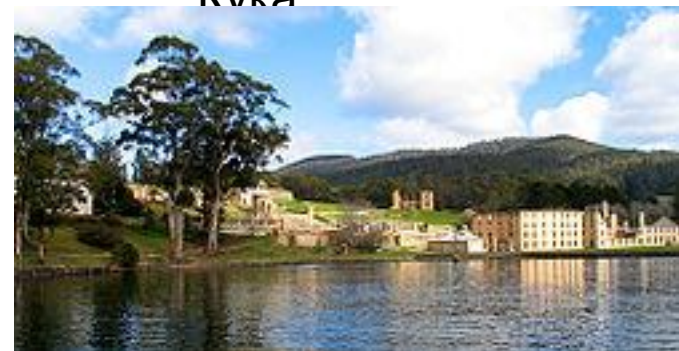
Порт-Артур на Тасмании был крупнейшей пересыльной базой преступников.