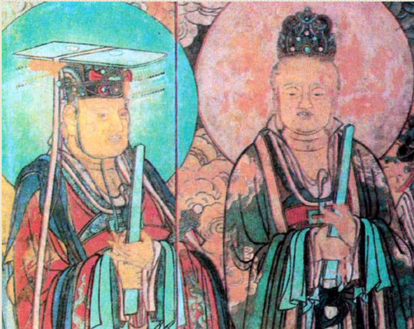
Портрет Лао-цзы (справа). Фреска. 1260-1368 гг.