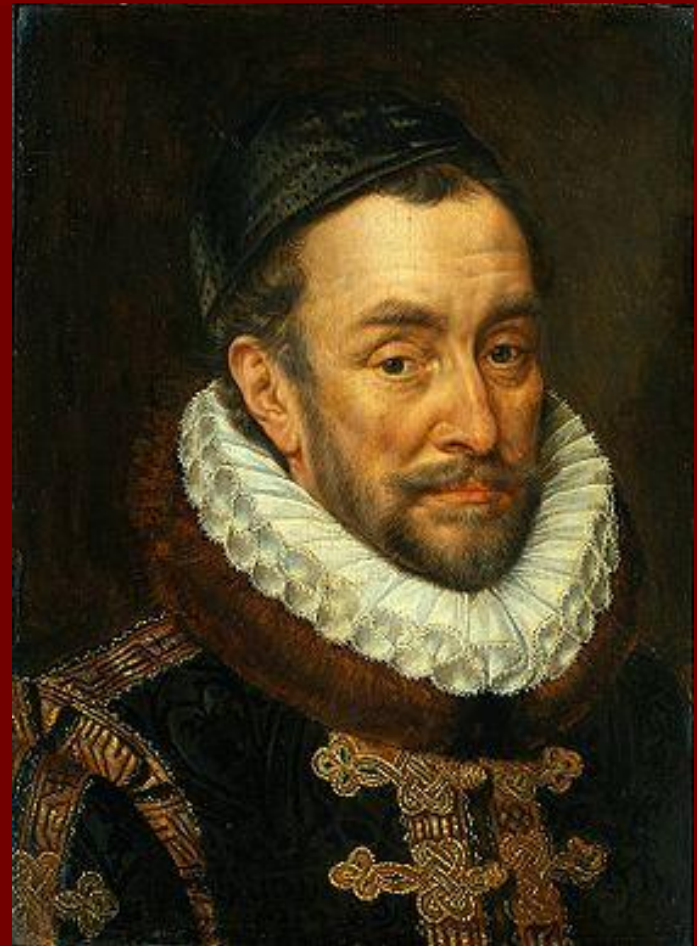
Вильгельм I Оранский