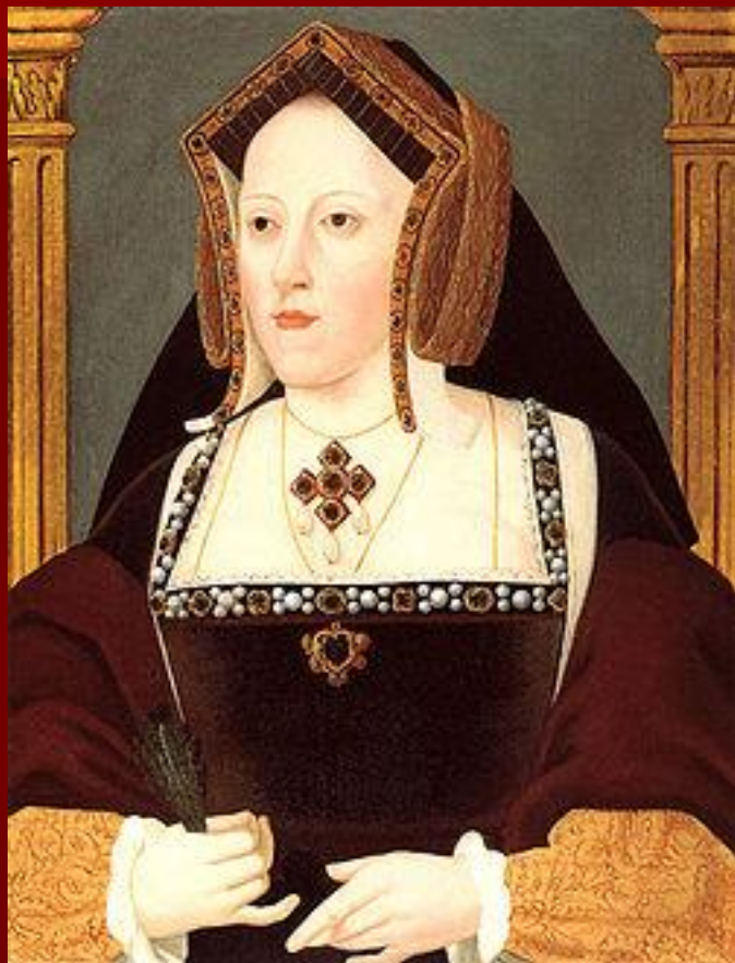
1 - Екатерина Арагонская