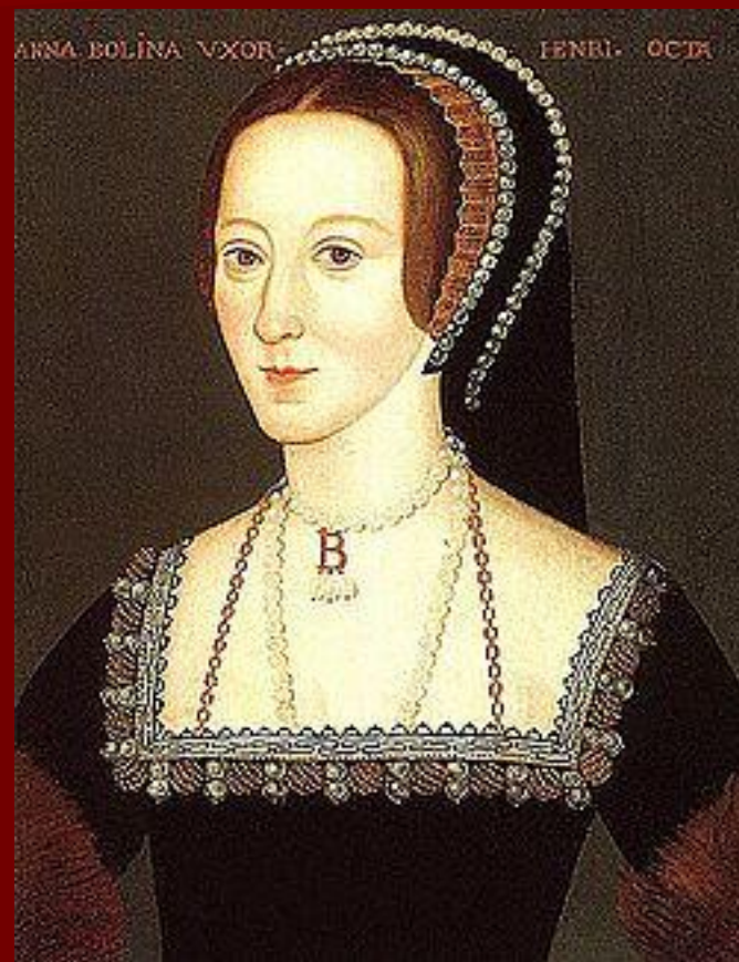
2 - Анна Болейн