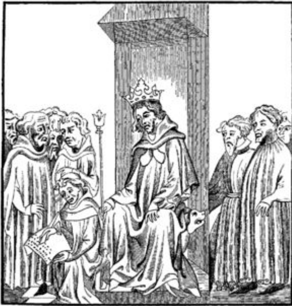
Fig. 7.—The King of the Franks, in the midst of the Military Chiefs who formed his Treuve , or armed Court, dictates the Salic Law (Code of the Barbaric Laws).—Fac-simile of a Miniature in the "Chronicles of St. Denis," a Manuscript of the Fourteenth Century (Library of the Arsenal).

Король касался своими руками бедняк нездорового, крестил е му слова.