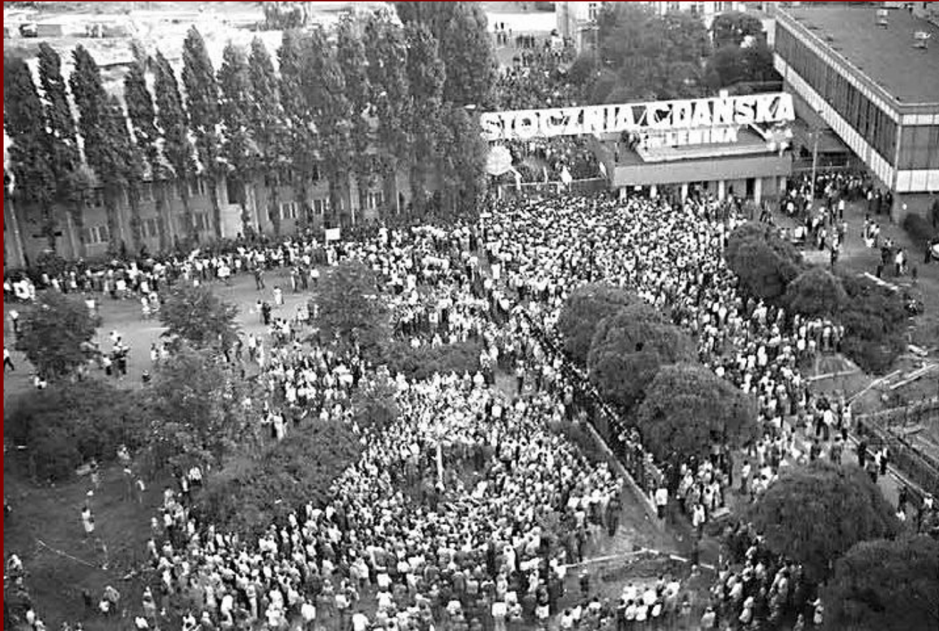
Забастовка, организованная Лехом Валенсой Судоверфь имени В.И. Ленина в г. Гданьск (Польша). 1970-начало – 1980-х гг.