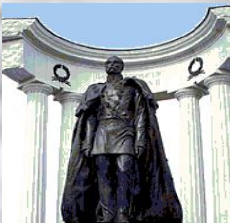
Памятник в Москве АЛЕКСАНДР11