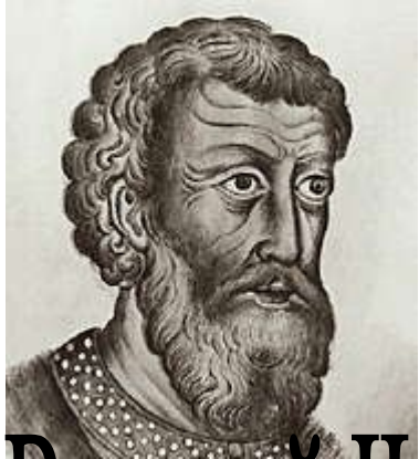
Василий II 1425-1462