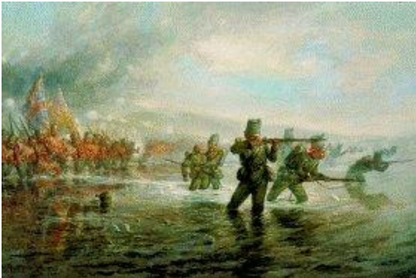
Переход реки Альмы англичанами