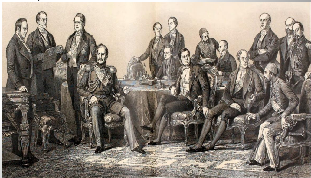
Cavour Cowley Buol Orlov Bourquenay Hilmar Walewski Djemil Benedetti Clarendon Brunner Aali Haridjeh Villamarina