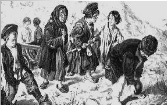
Дети, собирающие ядра.

На защиту города встали все жители. Дети приносили солдатам воду и продовольствие, а в промежутках между боями собирали неразорвавшиеся ядра. Знаменитый хирург Н. Пирогов добровольно прибыл в Севастополь и здесь впервые провел операцию с использованием наркоза в полевых условиях. Матрос П. Кошка прославился вылазками в стан врага.