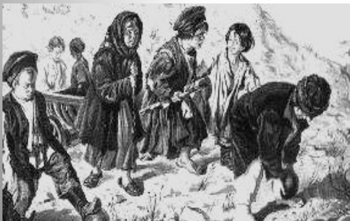
Дети, собирающие ядра.

На защиту города встали все жители. Дети приносили солдатам воду и продовольствие, а в промежутках между боями собирали неразорвавшиеся ядра. Знаменитый хирург Н. Пирогов добровольно прибыл в Севастополь и здесь впервые провел операцию с использованием наркоза в полевых условиях. Матрос П. Кошка прославился вылазками в стан врага.