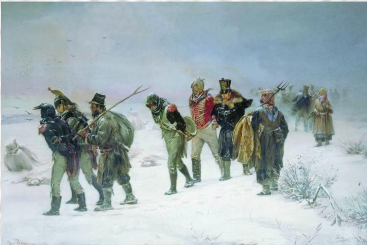
«Французы в 1812 г., пленённые партизанами (И. М. Прянишников)»