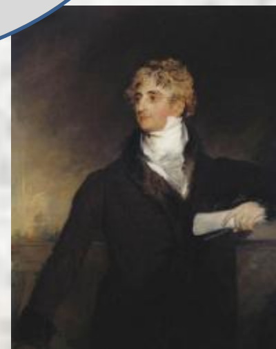
Дюк де Ришелье

«Государь желает иметь при себе в числе гвардии своей конных сотню казаков от Черноморского войска из лучших людей»