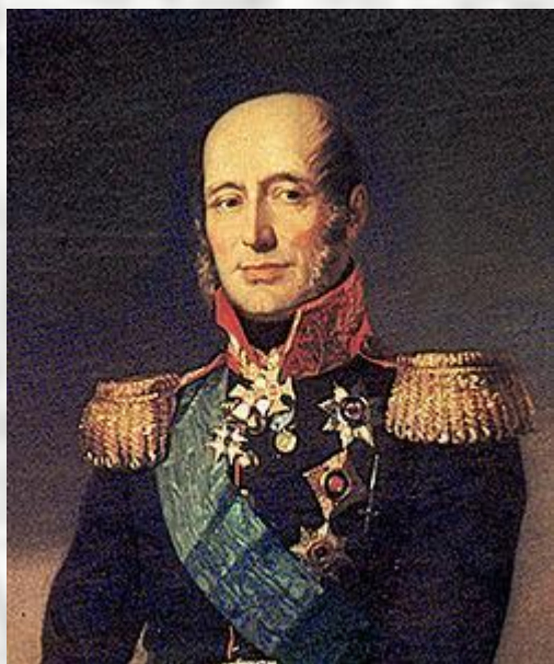
М.Б.Бараклай де Толли

«Государь желает иметь при себе в числе гвардии своей конных сотню казаков от Черноморского войска из лучших людей»