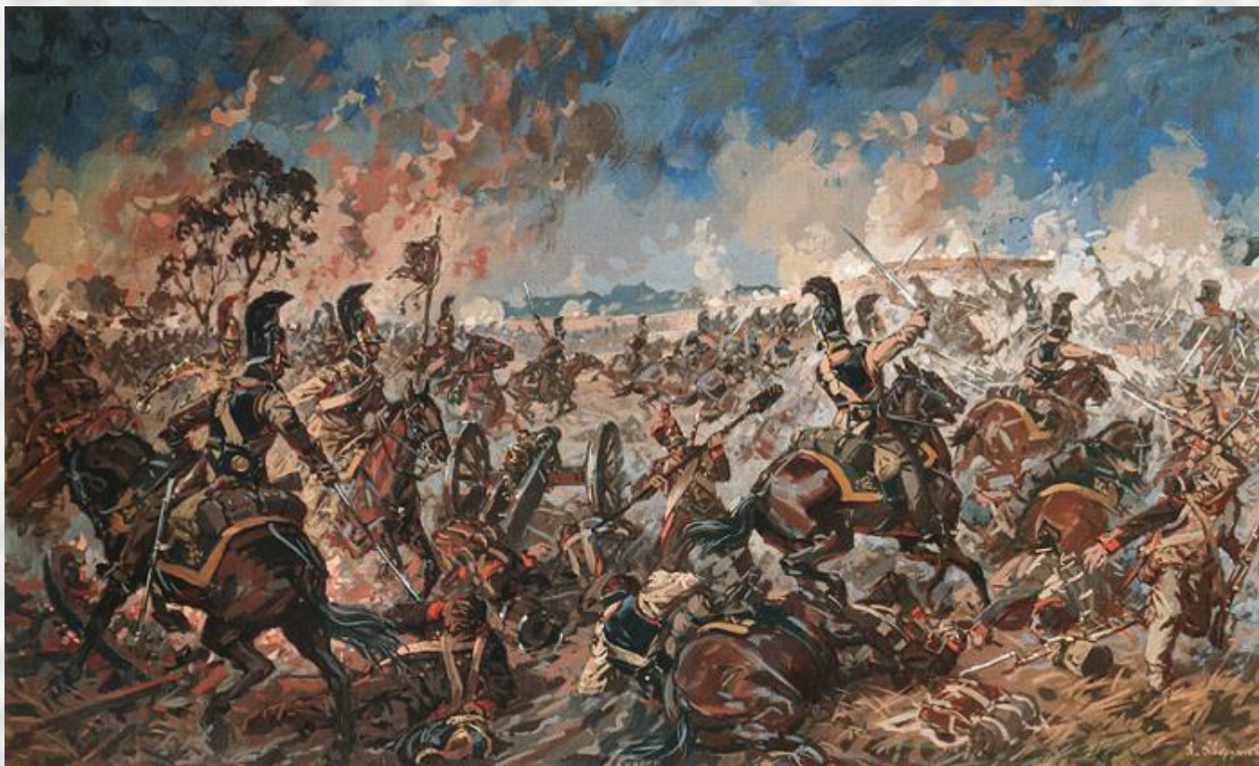
БОЙ ЗА ШЕВАРДИНСКИЙ РЕДУТ. 2002 АВЕРЬЯНОВ А.Ю.