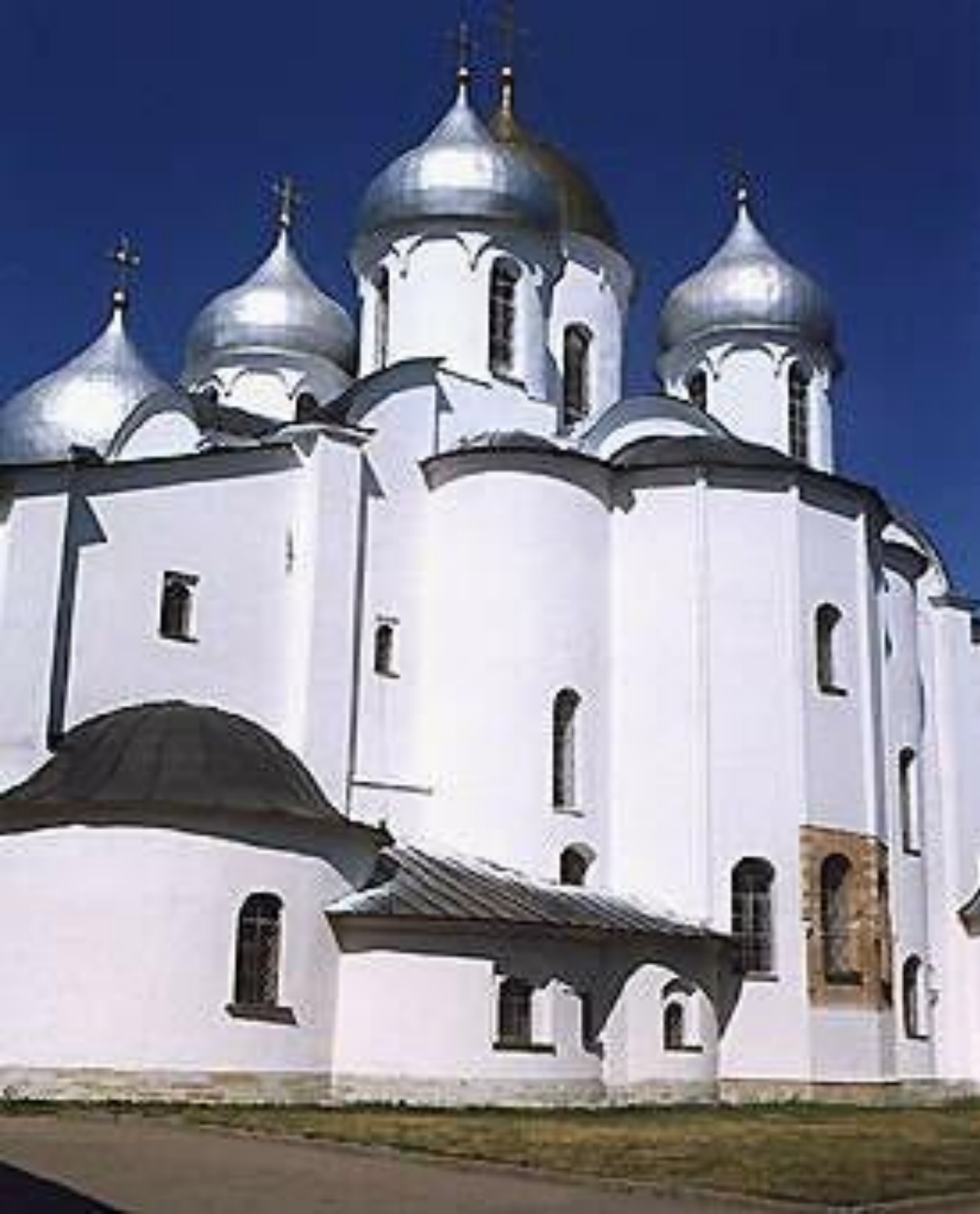
Софийский собор в Новгороде 1045-1050 гг.