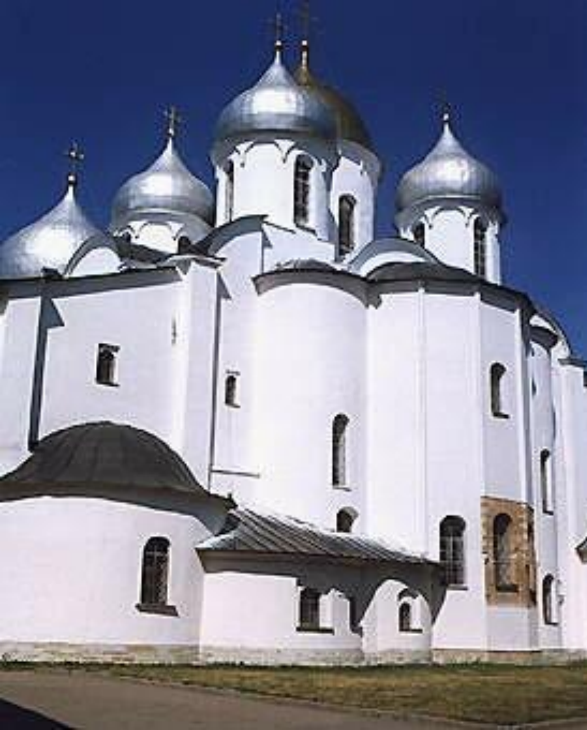
Софийский собор в Новгороде 1045-1050 гг.