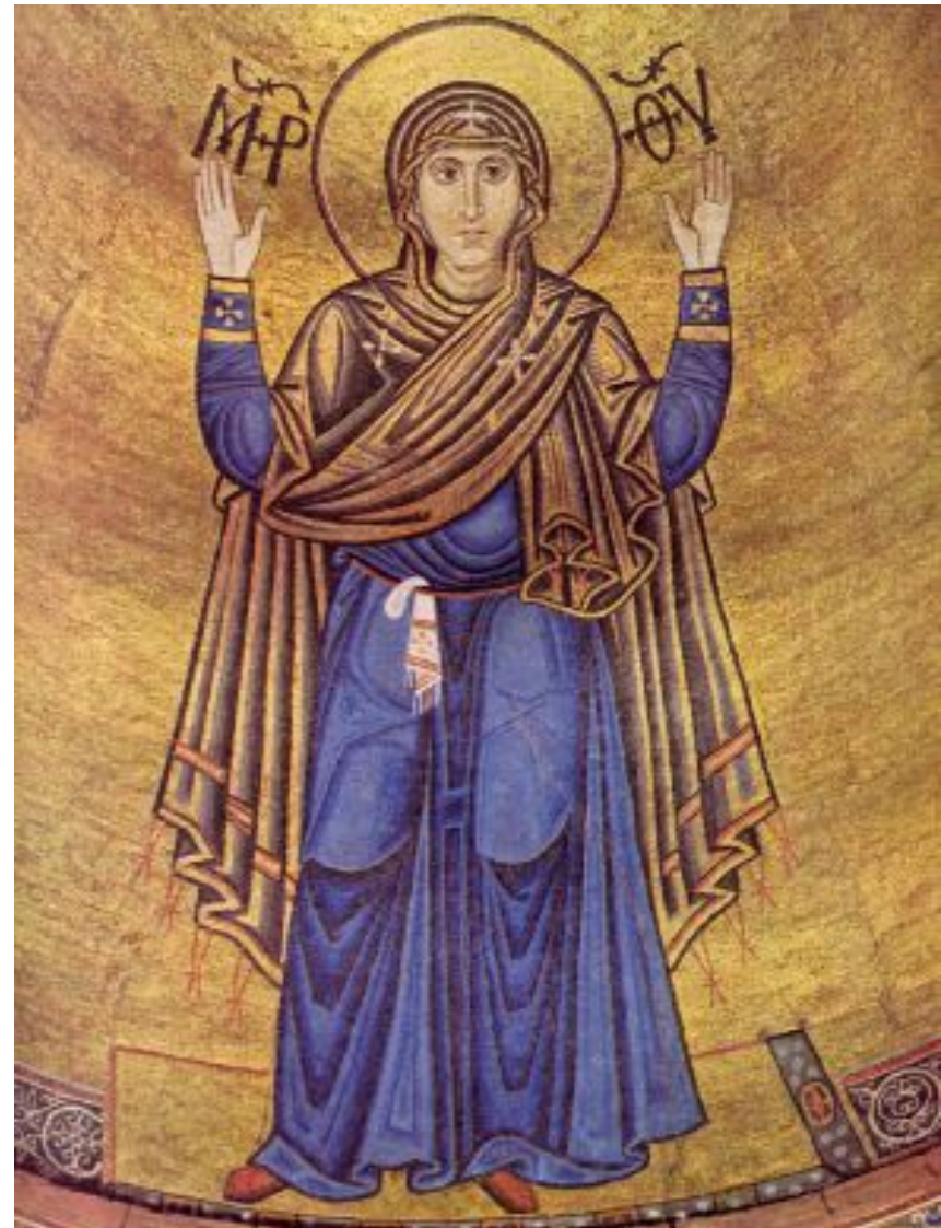
Интерьер Софии Киевской