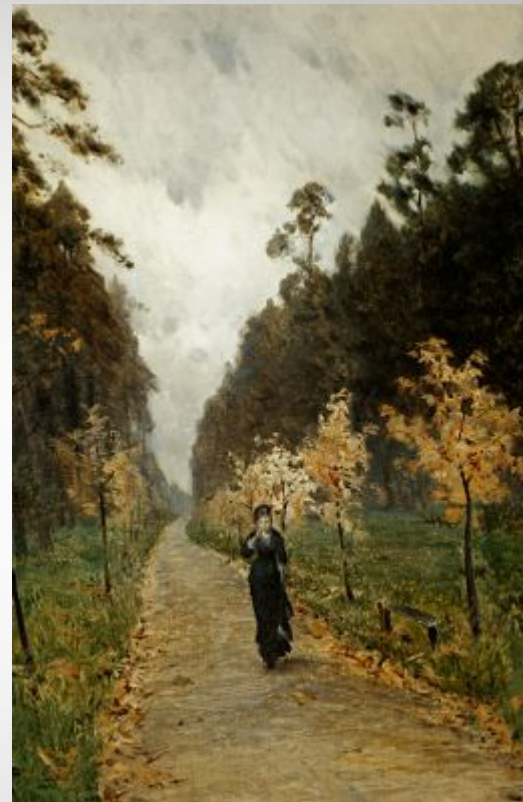
Осенний день в Сокольниках.

Три женщины на дороге - Казимир Малевич.