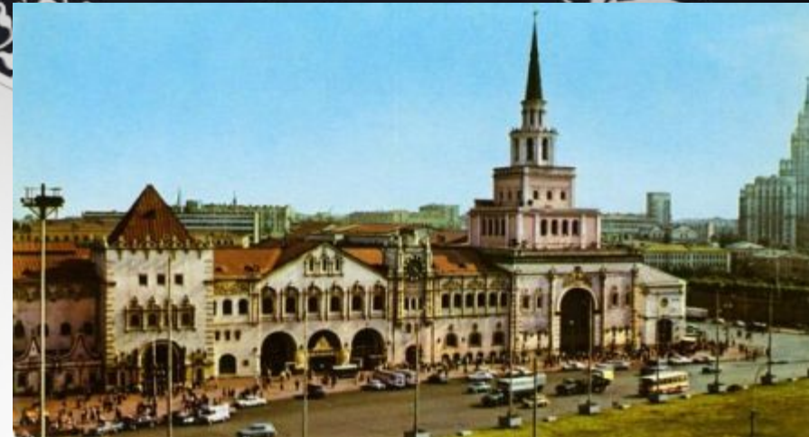
казанский вокзал А. В. Щусев

музей изобразительных искусств И. И. Рерберг