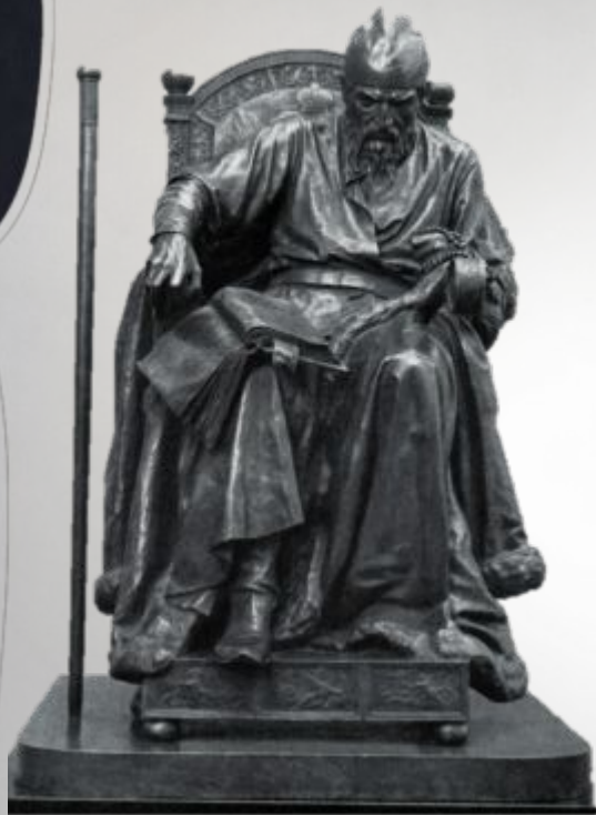
«Иван Грозный» М.М. Антокольский