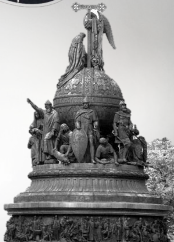
«Памятник тысячелетие России» М.О.Микешин