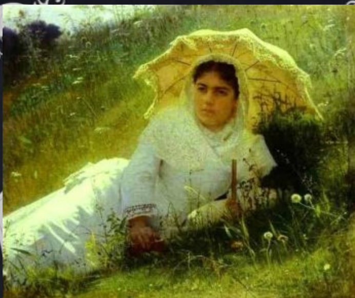
«Женщина с зонтиком»