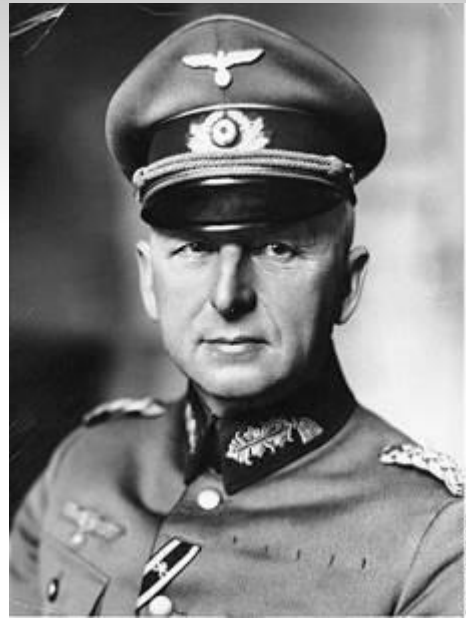
генерал-фельдмаршал Фриц Эрих фон Манштейн (группа армий «Юг»)