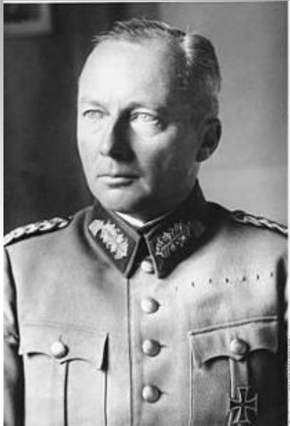
генерал-фельдмаршал Гюнтер Ханс фон Клюге (группа армий «Центр»)