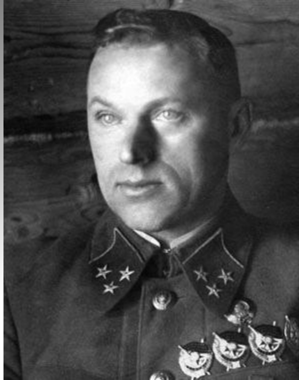
Войска Центрального фронта, командующий — генерал армии Константин Рокоссовский