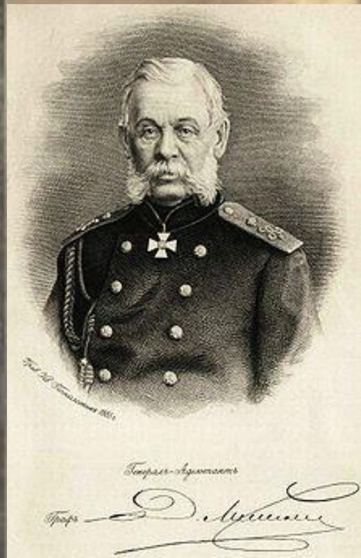
Военный министр Д.А.Милютин

В 1874 г. была проведена военная реформа по инициативе Д.А.Милю тина. Рекрутский набор заменялся всеобщей воинской повинностью с 20-летнего возраста.