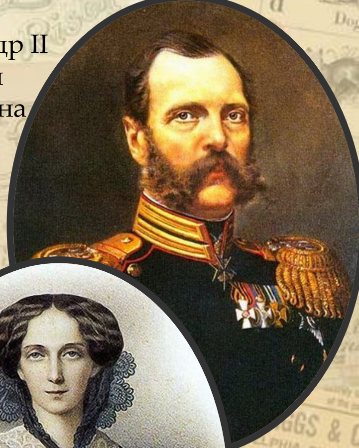
Александр II и Мария Федоровна