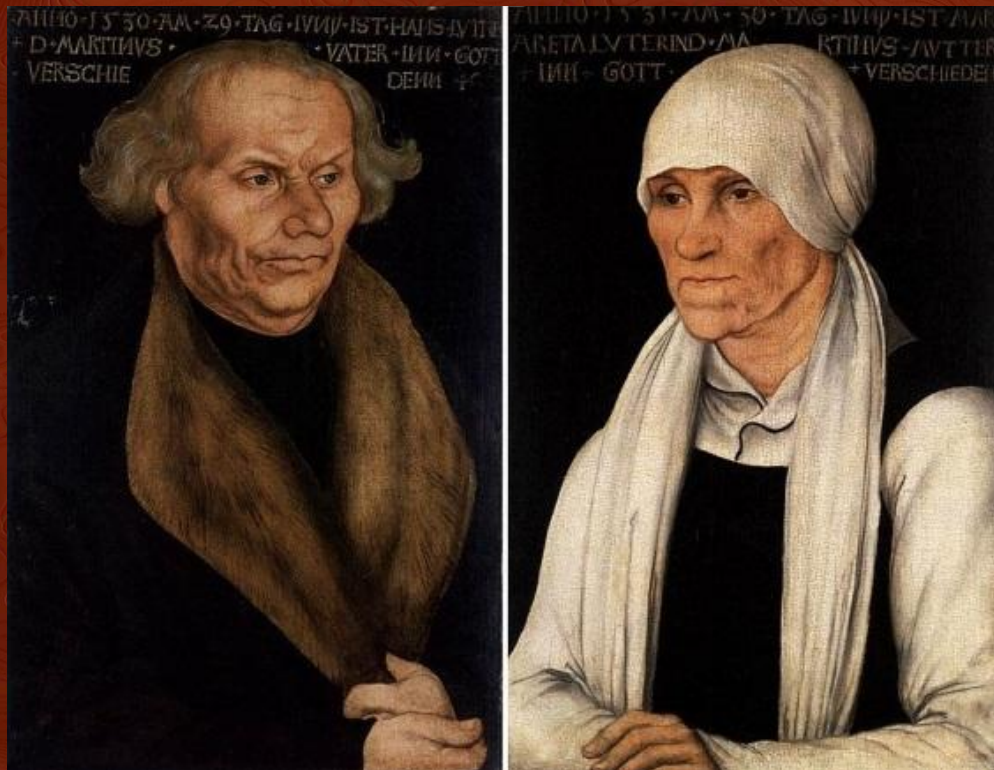
Лукас Кранах. Ганс и Маргарита Лютер

Мартин Лютер родился в семье Ганса Лютера (1459—1530) — бывшего крестьянина, перебравшегося в Эйслебен (Саксония) .. После рождения Мартина семья переехала в горный городок Мансфельд, где отец стал зажиточным бюргером