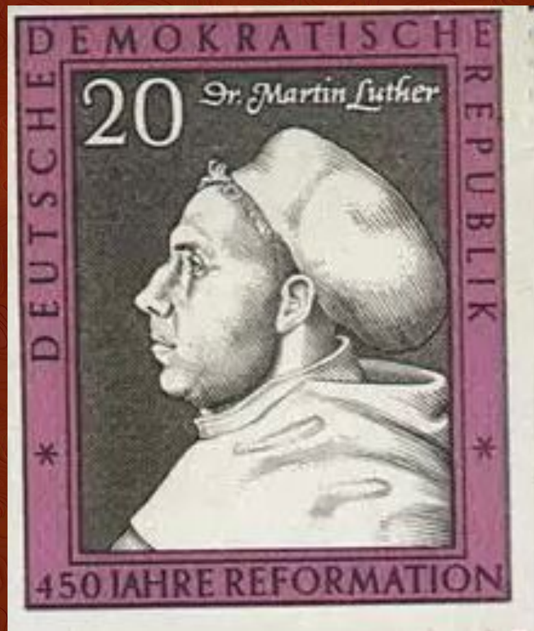
Почтовая марка ГДР