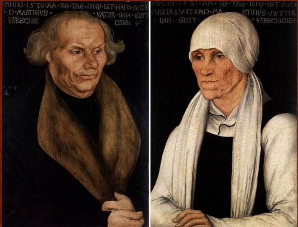
Лукас Кранах. Ганс и Маргарита Лютер

Мартин Лютер родился в семье Ганса Лютера (1459—1530) — бывшего крестьянина, перебравшегося в Эйслебен (Саксония) .. После рождения Мартина семья переехала в горный городок Мансфельд, где отец стал зажиточным бюргером