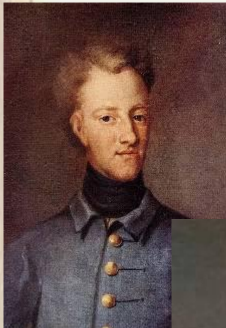
Карл XII, шведский король