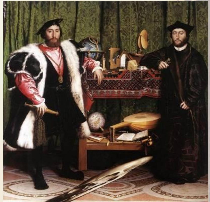
Ганс Гольбейн Младший Послы, 1533