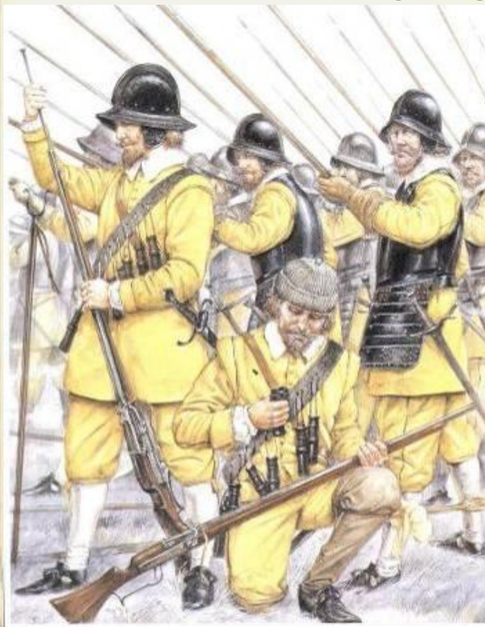
Солдаты «Желтой» бригады одного из основных подразделений шведов в битве при Лютцене 1632 год.