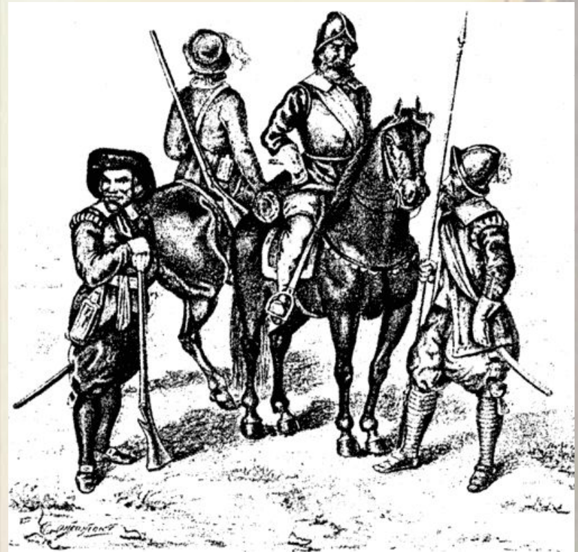
Шведские воины эпохи Густава-Адольфа (слева направо): мушкетер, драгун, кирасир, пикинер