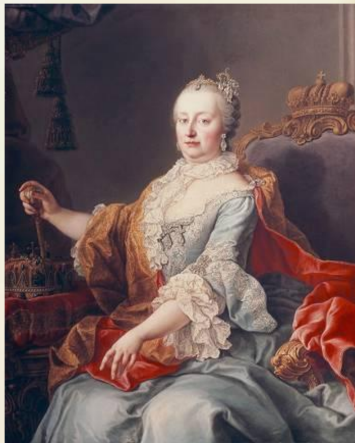
Мария Терезия Австрийская

Победила сторона Марии Терезии. Но Пруссия , захватив Силезию, стала угрожать дальнейшей стабильности.