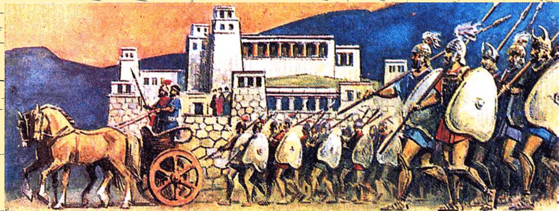
Выступление войска из древних Микен