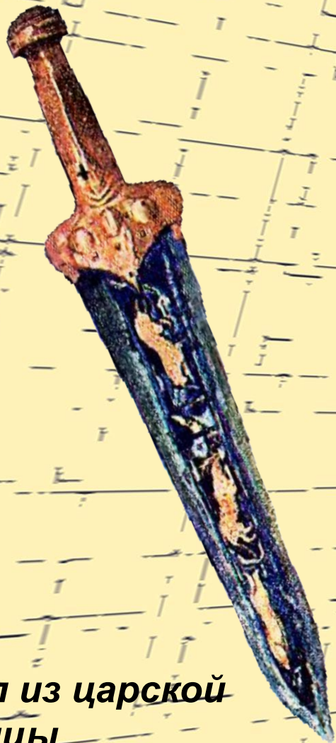
Кинжал из царской гробницы