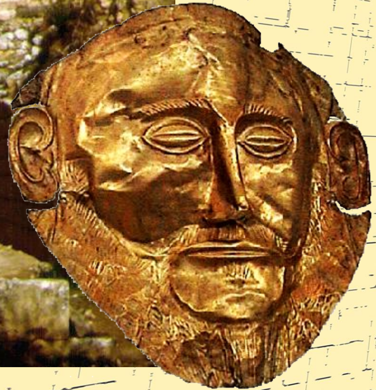
Гробница царя Агамемнона