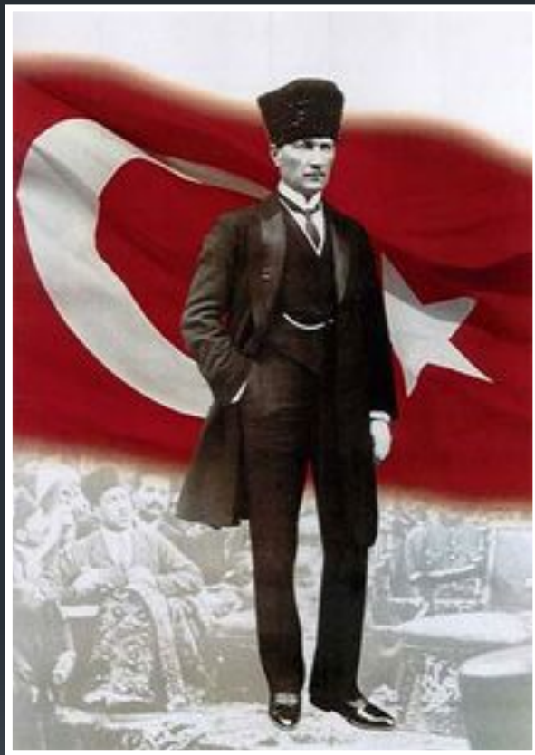
Мустафа Кемаль основатель и первый лидер Республиканской народной партии Турции