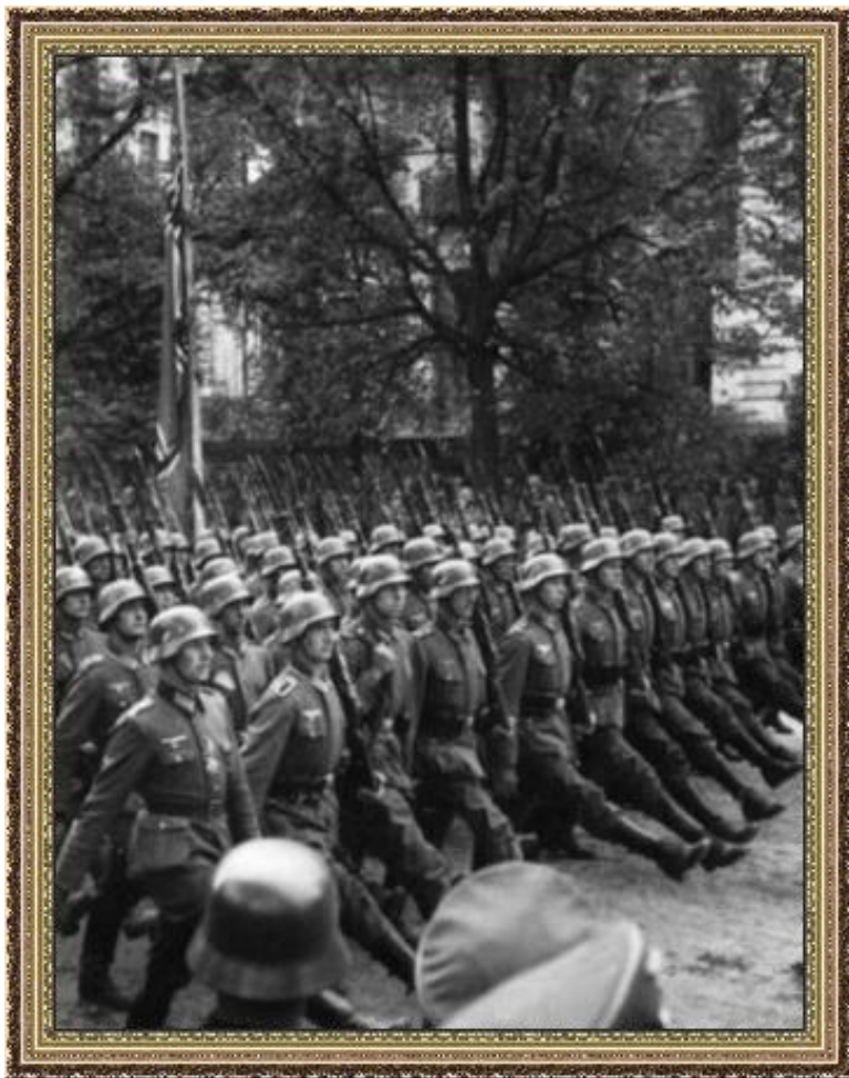
Парад немецких войск под Гданьском

1.09.1939 – Нападение Германии на Польшу. 50 дивизий.