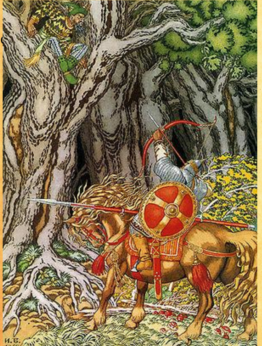
• И.Я. Билибин. Илья Муромец и Святогор