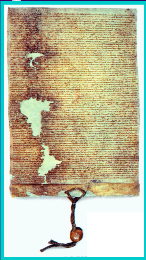
Великая хартия вольностей.