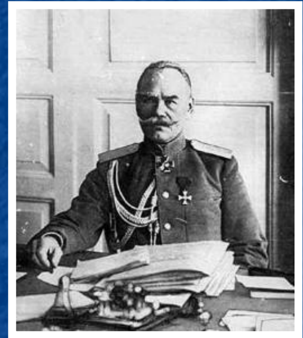
Верховный руководитель Добровольческой армии А.В.Алексеев

Дальний Восток: высадка американских и японских войск.