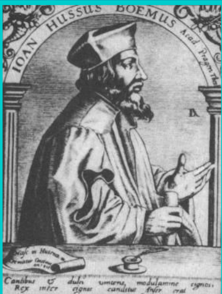
Ян Гус. Гравюра 15 в.

Во главе борьбы с иностранцами встал профессор Пражского университета-Ян Гус-первый чех, выпускник университета.