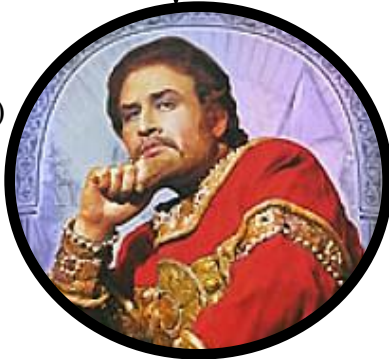
Князь Игорь (912—945)