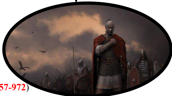
Князь Святослав (957-972)