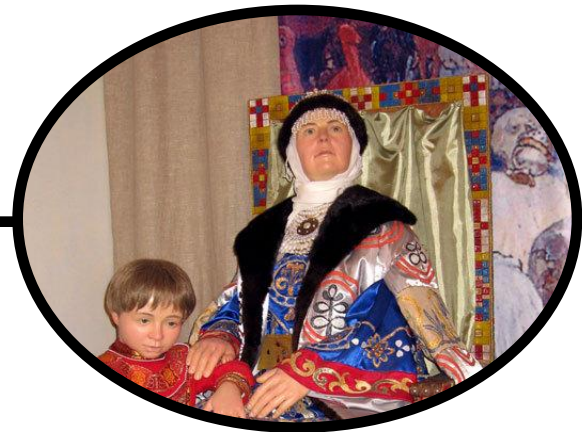
Правительница княгиня Ольга (945—964) (при Святославе)