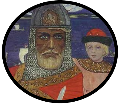
Правитель Олег (879—912) (при малолетнем Игоре)