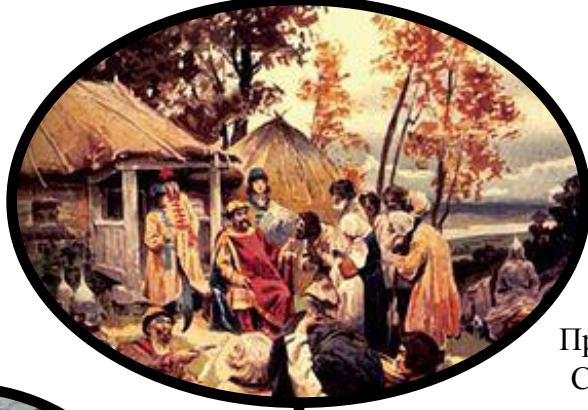
Призвание варягов, Рюрик, Синеус, Трувор (862-879)