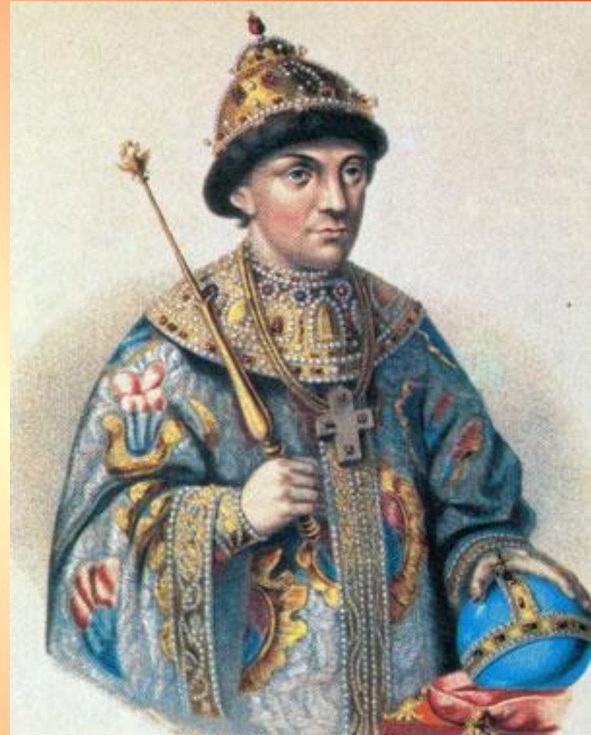
Федор Алексеевич (1661-1682)