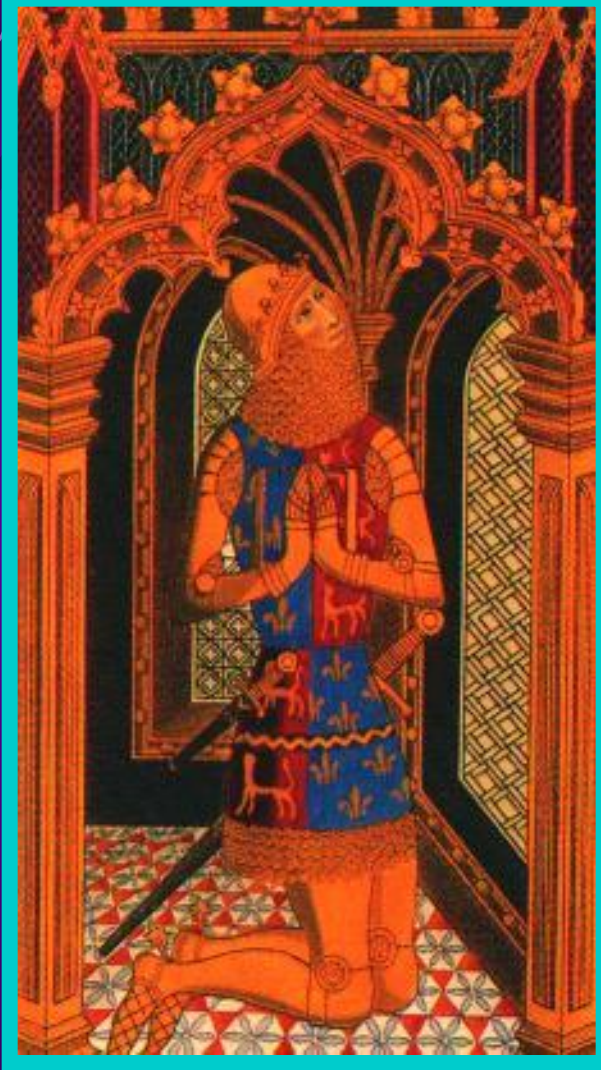
«Черный принц» Эдуард.

Французы имели двое- кратный перевес. Ан- глийский командующий - принц Эдуард(Черный рыцарь) хотел оставить добычу, лишь бы его войско пропустили на юг.