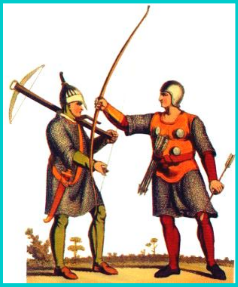
Большой лук-вооружение английских воинов.

Во время Столетней войны произошли революционные изменения в военном деле. На смену холодному оружию пришло огнестрельное.