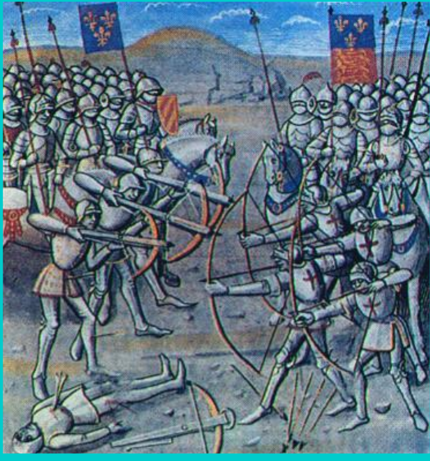
Битва при Кресси. Средневековая миниатюра.

В 1340 г. в морском сражении при Слейсе флот Франции был разбит .