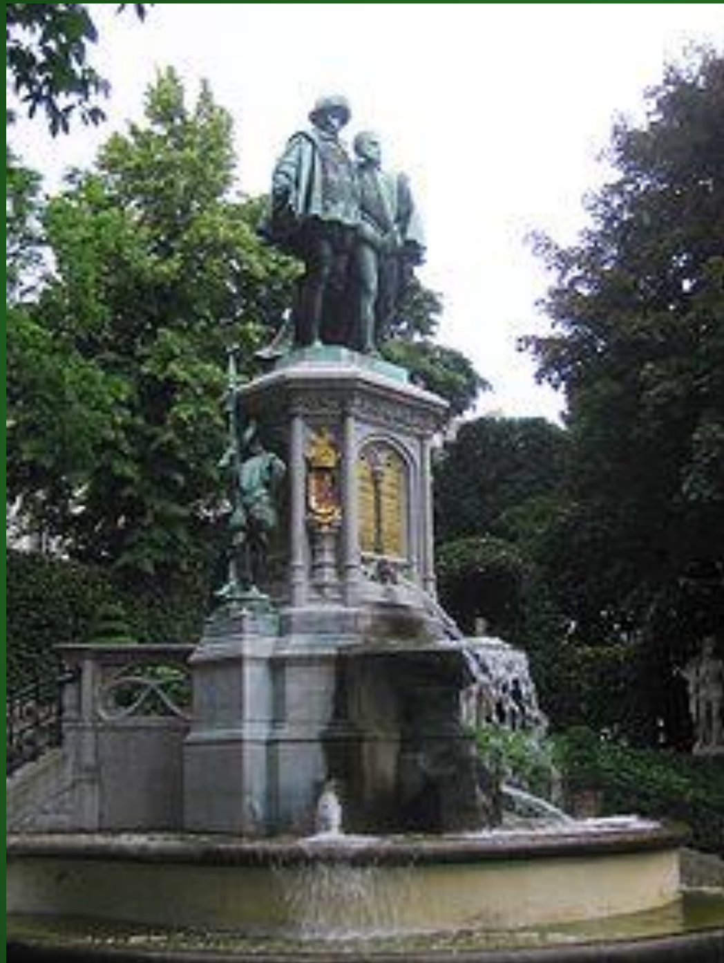
Памятник Эгмонту и Горну