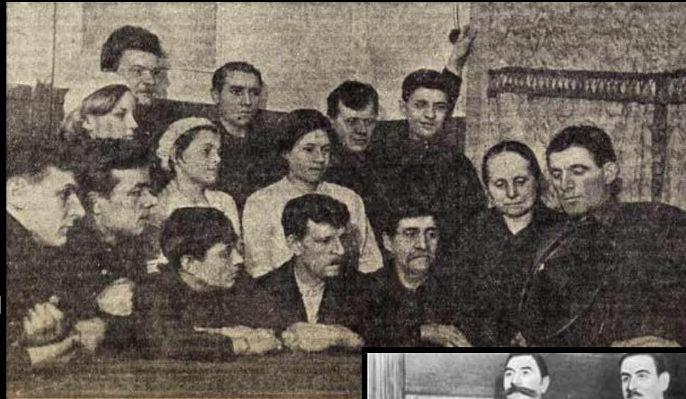
В общежитии Подшипникового завода имени Л. М. Кагановича по делу антисоветского «право-троцкистского блока».

Бухарин был одним из главных обвиняемых на показательном процессе по делу «Антисоветского правотроцкистского блока». Как почти все другие обвиняемые, признал вину и отчасти дал ожидаемые показания. В своём последнем слове, однако, сделал попытку опровергнуть возведённые на него обвинения. Хотя Бухарин все же и заявил: «Чуждость моих преступлений безмерна», ни в одном конкретном эпизоде он прямо не сознался