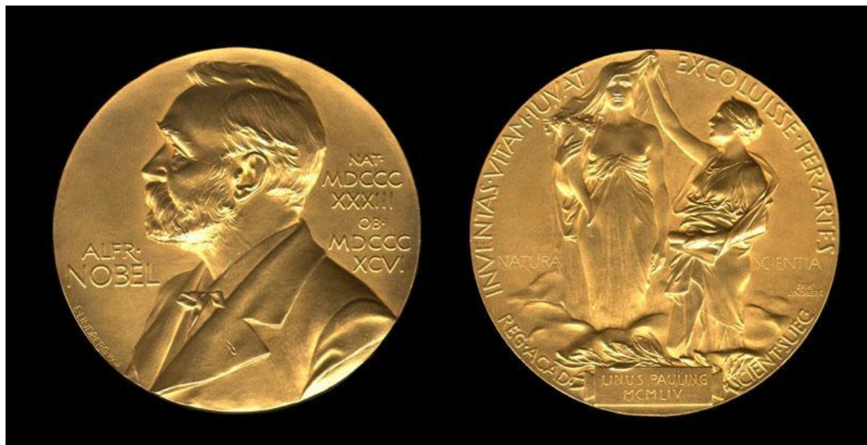
Медаль, вручаемая лауреату Нобелевской премии.

Нобелевская премия - одна из наиболее престижных международных премий, присуждаемая за выдающиеся научные исследования, революционные изобретения или крупный вклад в культуру или развитие общества.