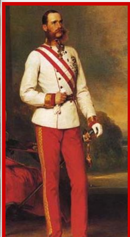
Император Австро- Венгрии Франц Иосиф

1867 г. - австро-венгерское соглашение о преобразовании империи Габсбургов в двуединую монархию Австро-Венгрию, состоявшую из двух независимых друг от друга во внутренних делах государств — Австрии и Венгрии.