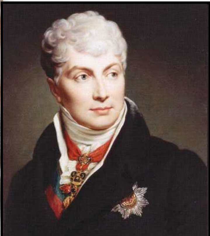
Клемент Венцель Меттерних