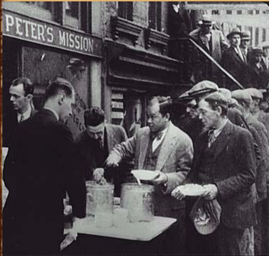
Очереди в столовые