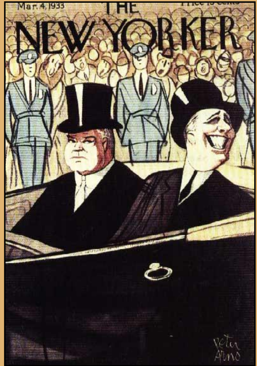
Гувер и Рузвельт