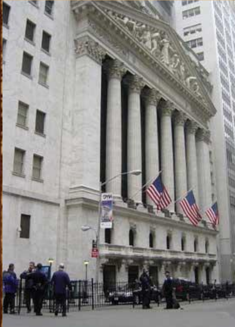
Нью-Йоркская фондовая биржа