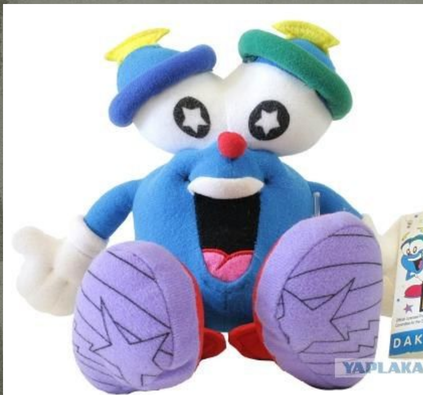
Иzzi: Олимпийские Летние игры, в 1996, в Атланте, США