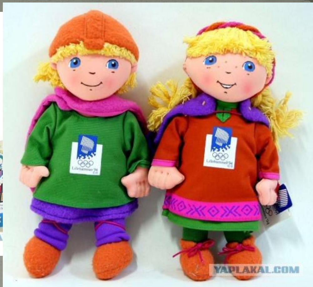
Хокон и Кристин : талисманы Зимних Олимпийских игр 1994 в Лиллехаммере, Норвегия