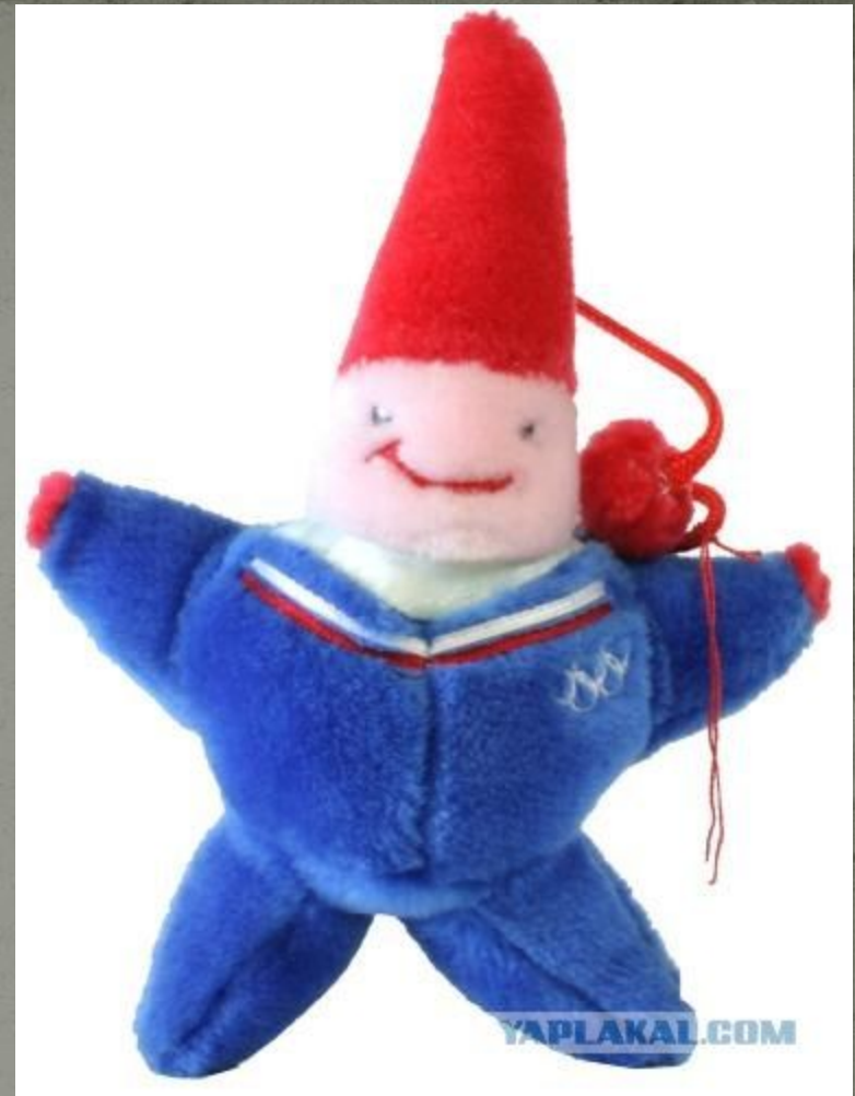
Magique (Магия): Зимние Олимпийские игры, 1992, Альбертвилль, Франция