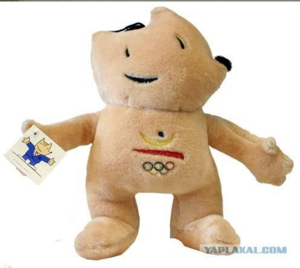
Коби: Олимпийские Летние игры, 1992, в Барселоне, Испания