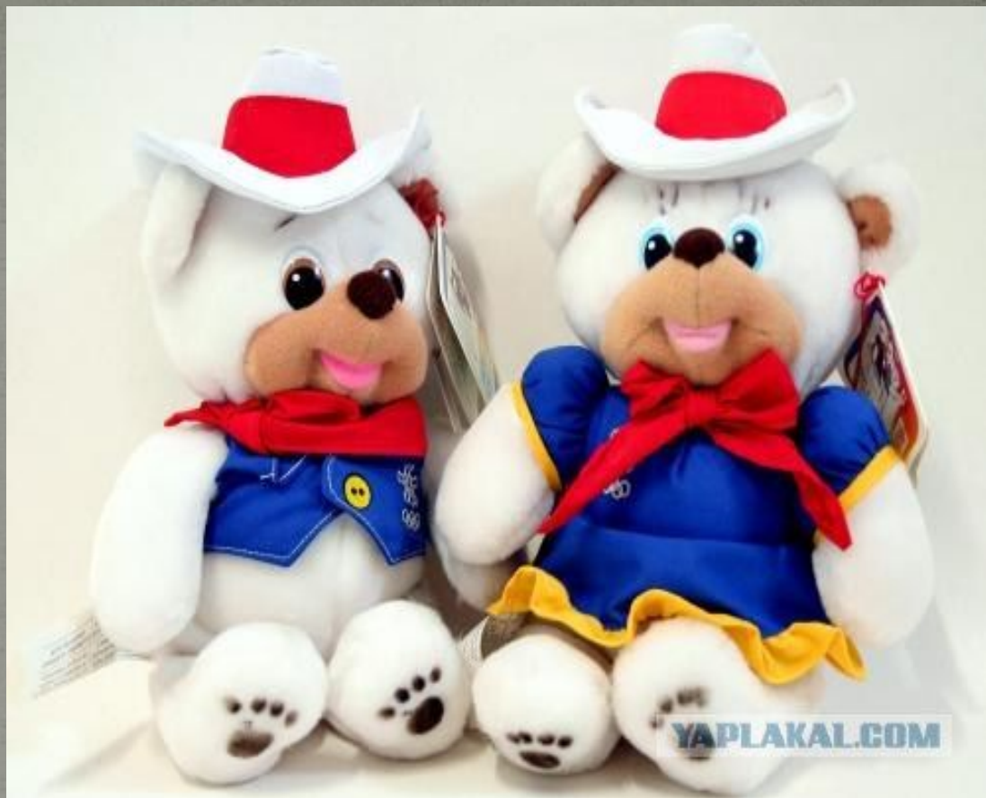
Хайди и Хоуди: талисманы Зимних Олимпийских игр 1988 в Калгари, Канада