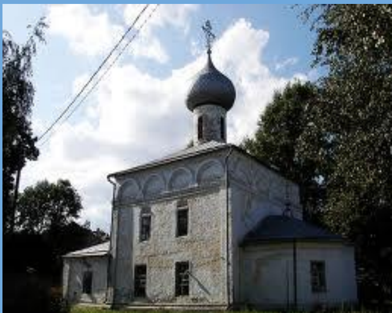
церковь Ильи в Каменье