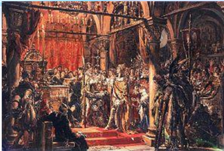
Коронация Болеслава I Храброго