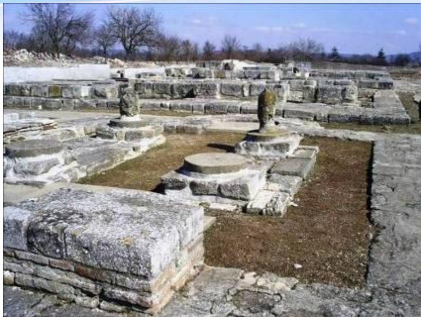
Развалины болгарского города Плиска