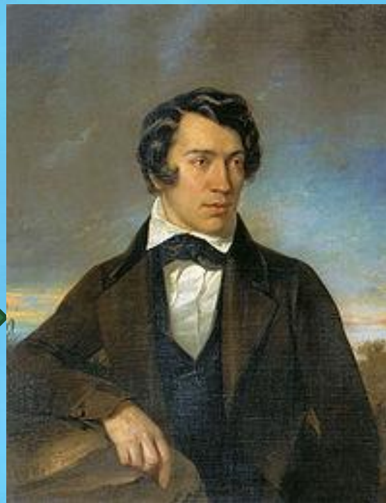
А. С. Хомяков