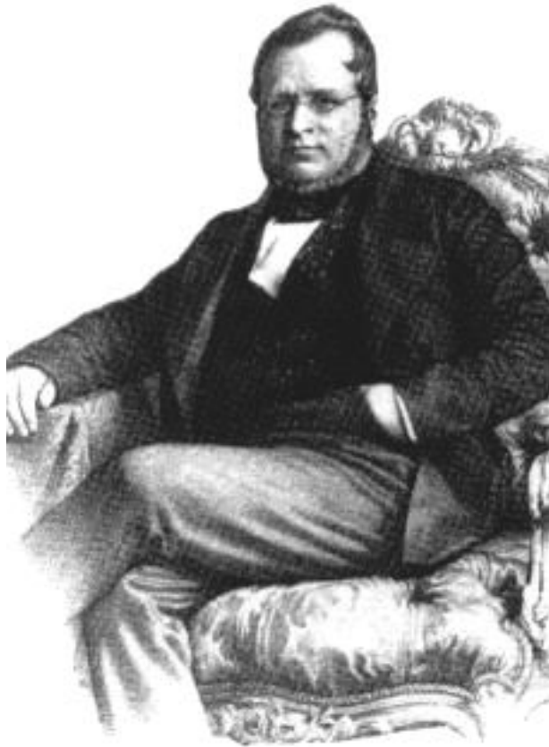
Граф Кавур. Гравюра 2- пол.19 в.