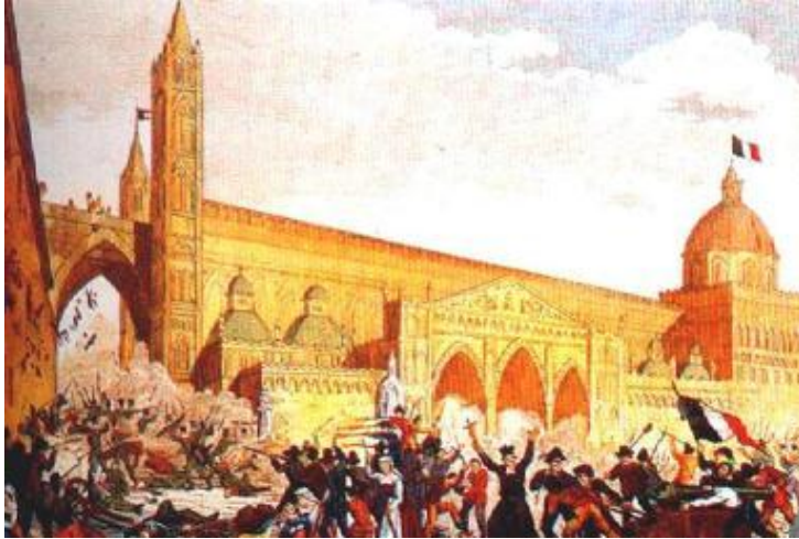
Восстание в Палермо.