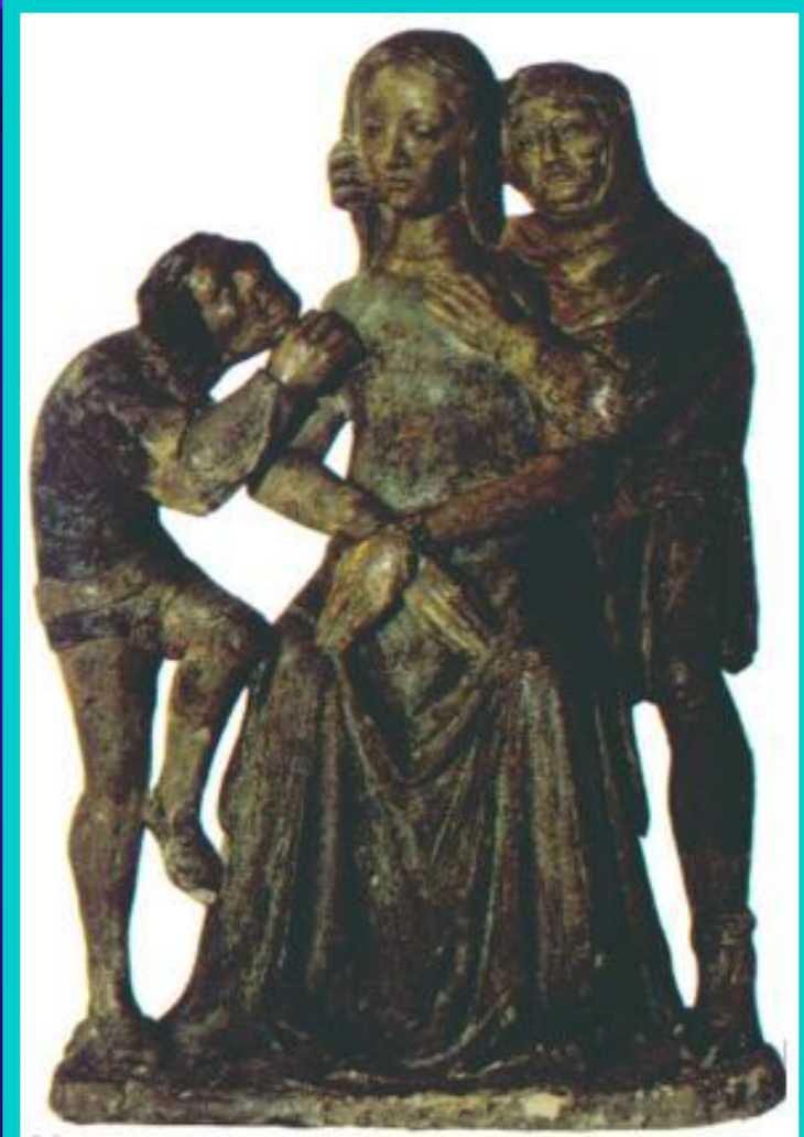
Жанна д'Арк перед казнью.

Несколько месяцев Жанна провела в тюрьме. Враги короля хотели допытаться от нее признания, что она - слуга дьявола.