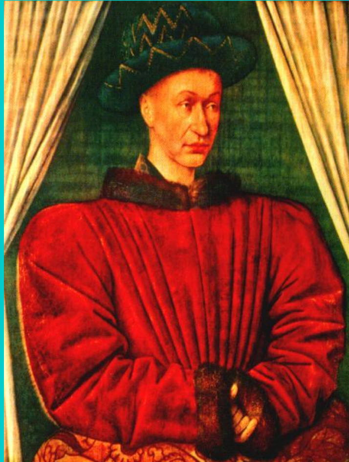
Ж.Фуке.Портрет Карла VII.

Новым королем стал годовалый ребенок. Но 15-летний сын Карла VI бежал из Парижа и провозгласил себя Карлом VII.