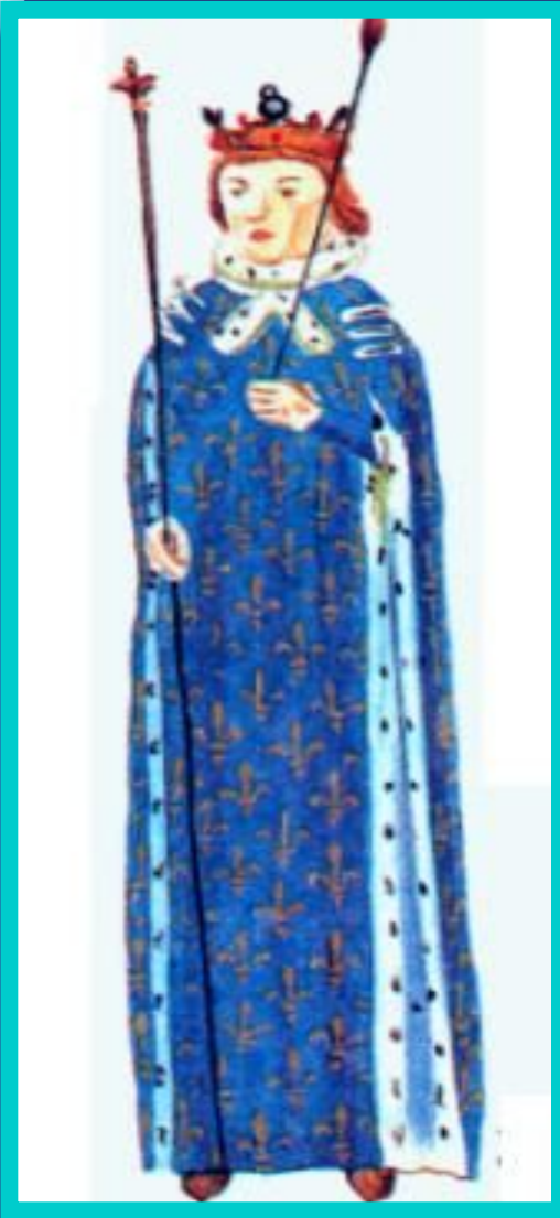
Карл VI Безумный.

Карл VI был психически болен. 2 группы феодалов вели борьбу за влияние на него. Одной руководил герцог Бургундский, другой - граф Арманьяк.