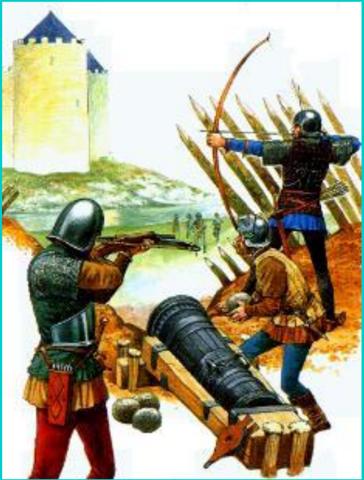
Осада Орлеана. Современный рисунок.

Осада длилась 200 дней. В стране началась партизанская война. Во главе народных масс встала Жанна д'Арк. Она утверждала что «голоса» велели начать борьбу с англичанами.