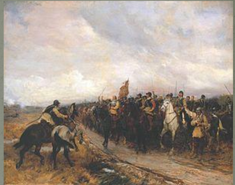
Кромвель в сражении при Данбаре

Он жестоко подавил восстания в Ирландии и Шотландии. Так, 3 сентября 1650 года в битве при Данбаре была разбита шотландская армия, почти вдвое превышающая по численности силы англичан. Ровно через год, 3 сентября 1651 года, англичане под стенами Вустера под командованием Оливера Кромвеля одержали окончательную победу над шотландцами. Разделил страну на двенадцать военных губернаторств во главе с подотчётными лично ему генерал-майорами. Ввёл охрану главных дорог. Наладил систему сбора налогов. Деньги, причём немалые, на все преобразования он взыскал с побеждённых сторонников короля.