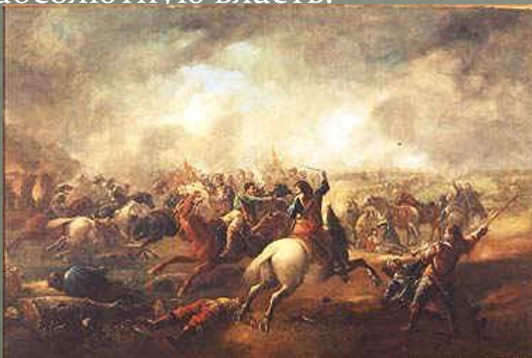
Бой при Марстон-Муре