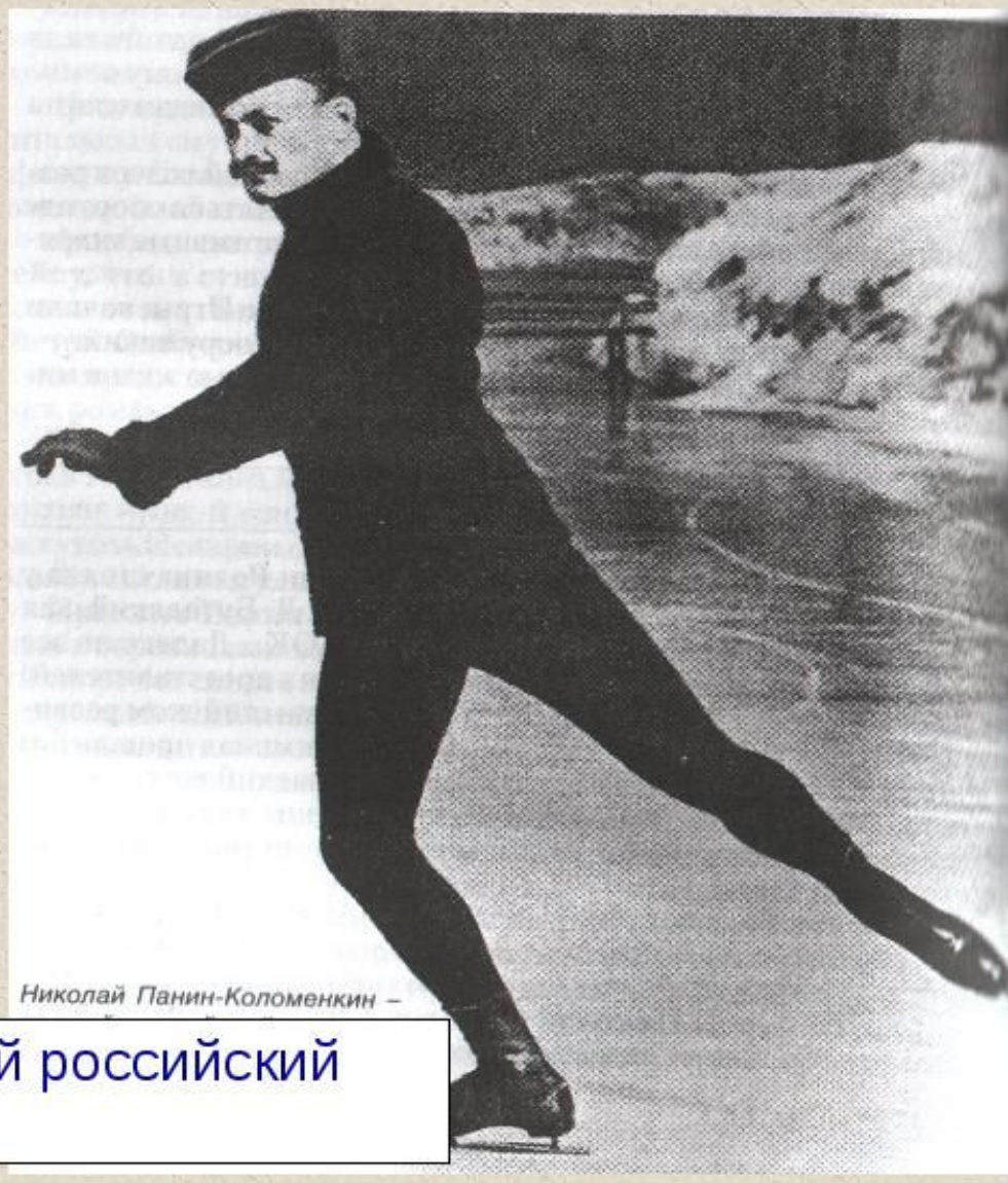
Николай Панин-Коломенкин –

Впервые российские спортсмены приняли участие в IV Олимпийских играх ,которые состоялись в Лондоне в 1908 году.